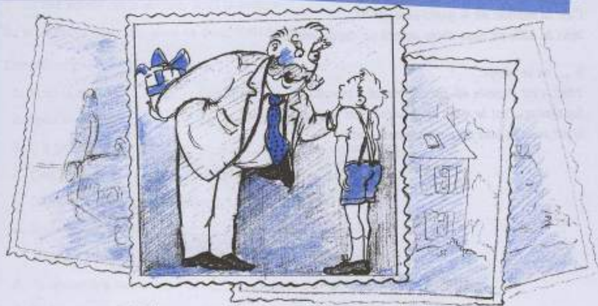
Cet homme, qui avait une énorme moustache, avait aussi une très grosse voix qui me faisait peur.